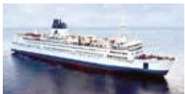
Esperanza del África