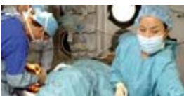
Cirugías y cuidados médicos