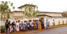
Programas en tierra